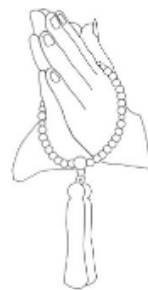
二輪(ふたつ)念珠の持ち方