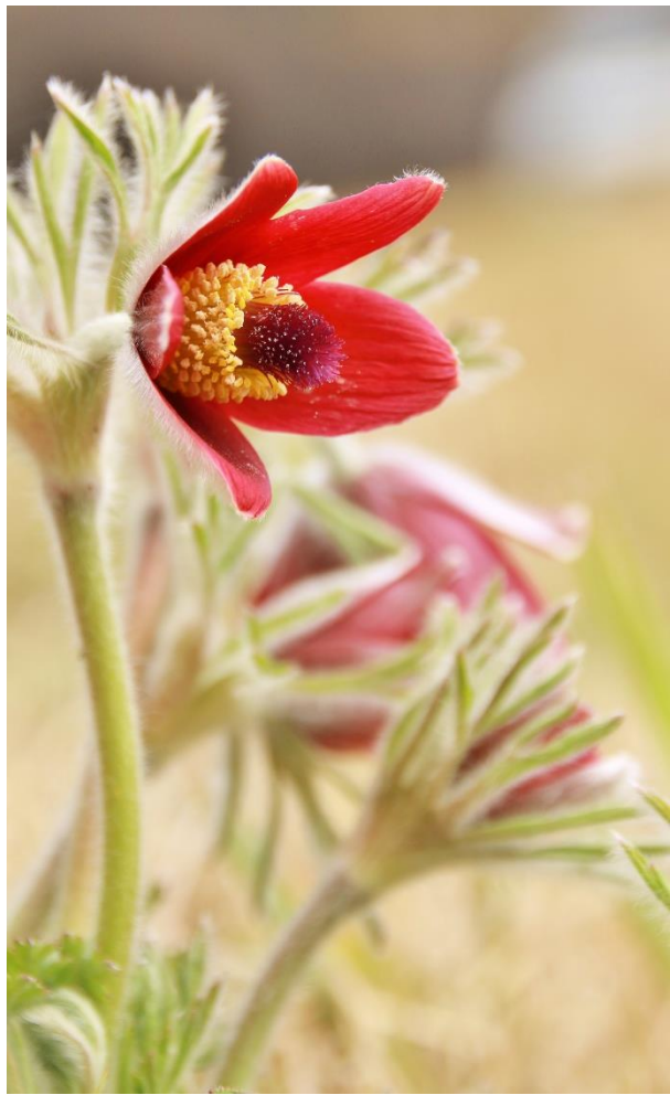
Photo:おきな草(戸川公園) 本弘寺別院 見ごろ:3月中旬~ 秦野市渋沢 1398-12 TEL:0463-82-9577 honkouji.wakka@gmail.com

ようやく寒さも緩み、少しずつ春の訪れを感じる今日このごろですね。春の訪れは嬉しいのですが、秦野に来てから花粉症になってしまった私には辛い季節もあります。皆さんは、いかがでしょうか。